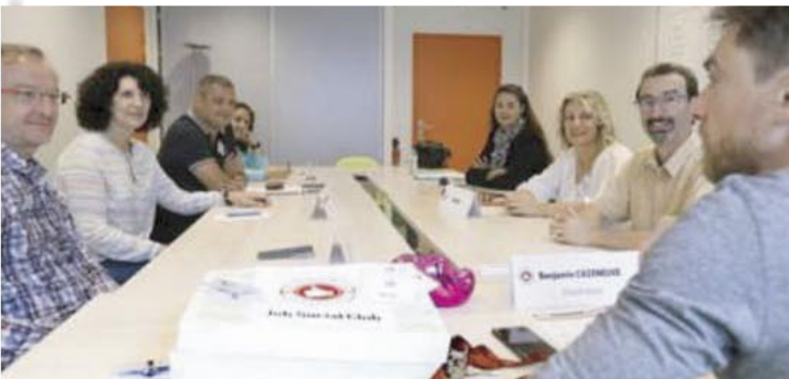
Les membres du Job social club se réunissent chaque jeudi dans les cocaux de la MJC des Fleurs.

"On ne perçoit pas toujours son propre réseau, mais on a tous un oncle ou une tante qui peuvent apporter quelques choses"